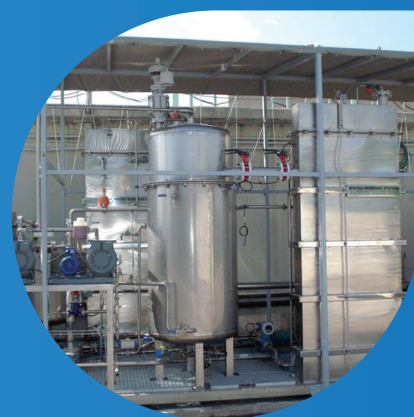
Prototipo de MBR